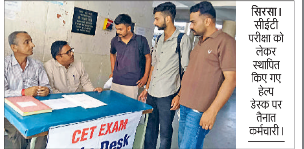
सिरसा। सीईटी परीक्षा को लेकर स्थापित किए गए हेल्प डेस्क पर तैनात कर्मचारी।