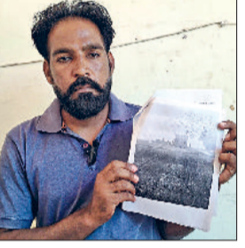
जाखल। गांव चुहड़पुर के पंच प्रतिनिधि पंचायती जमीन पर कब्जे की जानकारी देते हुए।