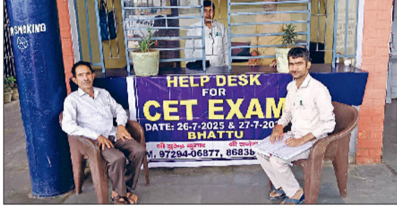
फतेहाबाद। सीईटी परीक्षार्थियों के लिए जिला प्रशासन द्वारा लगाए गए हेल्प डेस्क।

हरियाणा कर्मचारी चयन आयोग द्वारा 26 व 27 जुलाई को आयोजित होने वाली सीईटी परीक्षा को लेकर जिला प्रशासन ने फतेहाबाद में आने वाले परीक्षार्थियों की सुविधा के लिए शटल बस सर्विस की व्यवस्था की गई है। ये बसें जिला में निर्धारित किए गए 38 परीक्षा केंद्रों पर परीक्षार्थियों को लेकर जाएंगी और परीक्षा की समाप्ति के बाद वापिस छोड़ेंगी। हरियाणा रोडवेज विभाग द्वारा 90 शटल बस चलाई जा रही है। रोडवेज विभाग ने