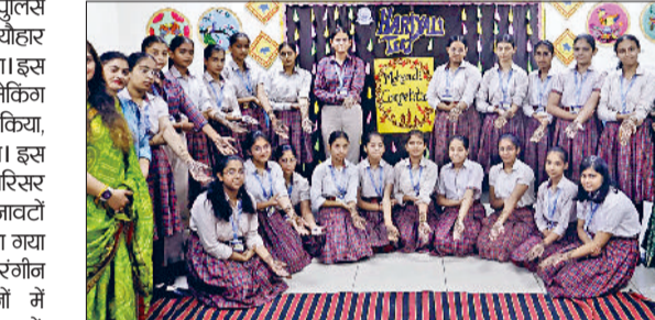
फतेहाबाद। डीएवी पुलिस स्कूल में तीज पर हाथों पर लगाई मेहंदी दिखाती छात्राएं।

फतेहाबाद। पुलिस लाइन स्थित डीएवी पुलिस पब्लिक स्कूल, फतेहाबाद में तीज का त्योहार बड़े उत्साह और उमंग के साथ मनाया गया। इस अवसर पर स्कूल ने मेहंदी और पोस्टर मेकिंग सहित कई प्रतियोगिताओं का आयोजन किया, जिनमें छात्रों ने सक्रिय रूप से भाग लिया। इस अवसर पर स्कूल परिसर को पारंपरिक सजावटों और झूलों से सजाया गया था और छात्रों ने रंगीन पारंपरिक परिधानों में भाग लिया। महोत्सव में