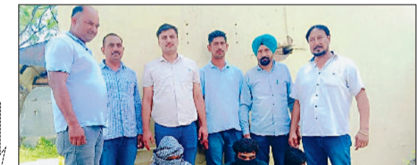
फतेहाबाद। पुलिस गिरफ्त में भूमी में चोरी के आरोप में पकड़े गए तीनों युवक।