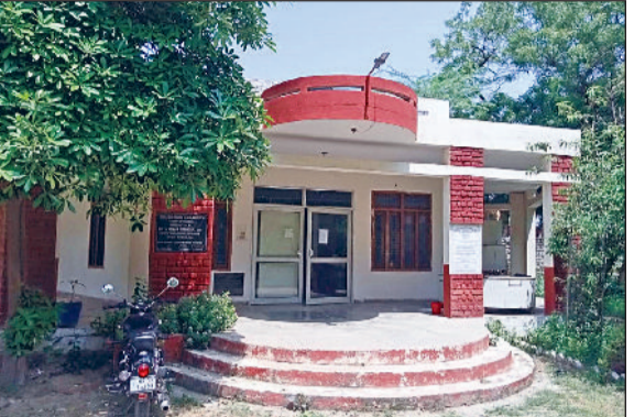
फतेहाबाद। डीसी को महानिदेशक द्वारा भेजा गया पत्र और बाल भवन में चल रहा अस्थाई जिला पुस्तकालय।

भवन, ठाकर बस्ती में चल रहा है, जबकि पुस्तकें व अलमारियां अभी भी नए बस स्टैंड पर रखी हुई हैं। इससे पुस्तकालय दो भागों में विभाजित हो गया है, जिससे छात्रों और पाठकों को भारी असुविधा हो रही है। पत्र में बताया गया है कि नए स्थान पर किराया हरियाणा रोडवेज