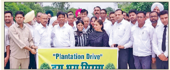
सिरसा। पौधरोपण का संदेश देते न्यायाधीश व अधिकारता।