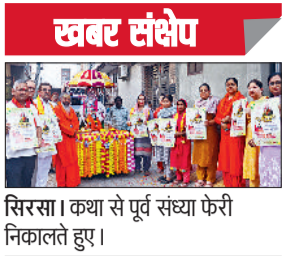
सिरसा। कथा से पूर्व संध्या फेरी निकालते हुए।