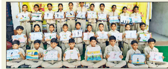
सिरसा। कारगिल विजय दिवस पर प्रतियोगिता में भाग लेते बच्चे।