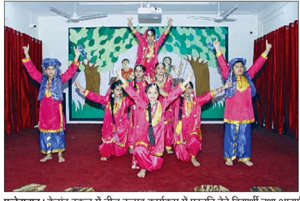
फतेहाबाद। क्रेसण्ट स्कूल में तीज उत्सव कार्यक्रम में प्रस्तुति देते विद्यार्थी तथा आदर्श स्कूल दरियापुर में तीज उत्सव पर प्रस्तुति देते विद्यार्थी।

क्रेसण्ट स्कूल में हरियाली तीज के अवसर पर रंगारंग सांस्कृतिक कार्यक्रम का आयोजन किया गया। कार्यक्रम की शुरुआत माता-पिता के स्वागत एवं तिलक समारोह के साथ हुई। प्रधानाचार्या एवं विशिष्ट अतिथियों द्वारा मां सरस्वती के समक्ष दीप प्रज्वलन एवं सरस्वती वंदना के साथ कार्यक्रम का शुभारंभ किया गया। कार्यक्रम में कक्षा पहली व दूसरी के नन्हे-मुन्हे विद्यार्थियों ने मनमोहक प्रस्तुतियां दीं। कक्षा दूसरी के विद्यार्थियों ने 'मेरा आपकी कृपा से' गीत पर संगीत प्रस्तुति तथा कक्षा 5वीं के विद्यार्थियों ने 'चल मेले नु चलिए' गीत पर गिट्टा प्रस्तुत कर सभी दर्शकों को मंत्रमुग्ध कर दिया। कक्षा दूसरी के नन्हे-मुन्हे विद्यार्थियों ने रैंप वॉक एवं कक्षा पहली के विद्यार्थियों ने 'माथे चमके बोरला' पर राजस्थानी नृत्य प्रस्तुत किया। कक्षा दूसरी के छात्र-छात्राओं ने 'मेरी बारी, अब तेरी बारी' गीत पर