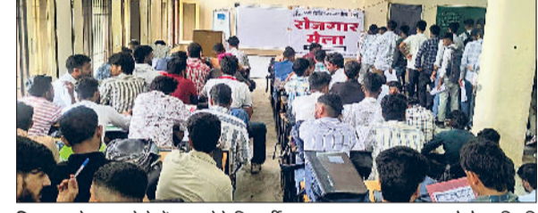
सिरसा। रोजगार मेले में भाग लेते विद्यार्थी।

रिपेयर एवं टूल एंड डाई (डाई और मोल्ड) जैसे विभिन्न ट्रेड से संबंधित 568 प्रशिक्षणार्थी (छात्र/छात्राएं) शामिल हुए। उनमें से 16 छात्राओं ने शिक्षता हेतु लिखित परीक्षा दी जिसमें 13 छात्राओं ने यह परीक्षा पास की। वहीं प्लेसमेंट के लिए 552 छात्रों ने लिखित परीक्षा में भाग लिया, जिनमें से 314 छात्रों ने परीक्षा पास की। इनमें से 12 छात्राओं को शिक्षता के लिए तथा